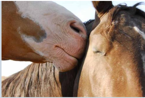
En äkta hästpuss.