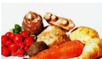
Härliga rotfrukter nu i säsong.