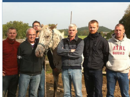
Ledarskapsutbildning med häst för en grupp ledare från Försvarmakten och Sjöstridsskolan..

"Lycka är att se, se det stora i det lilla"